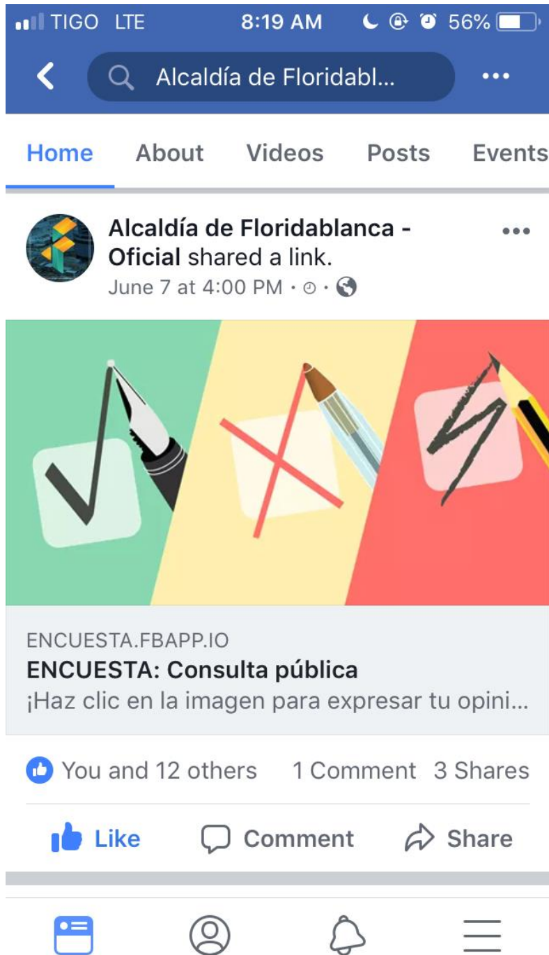
Figura 1. Evidencia publicación consulta pública